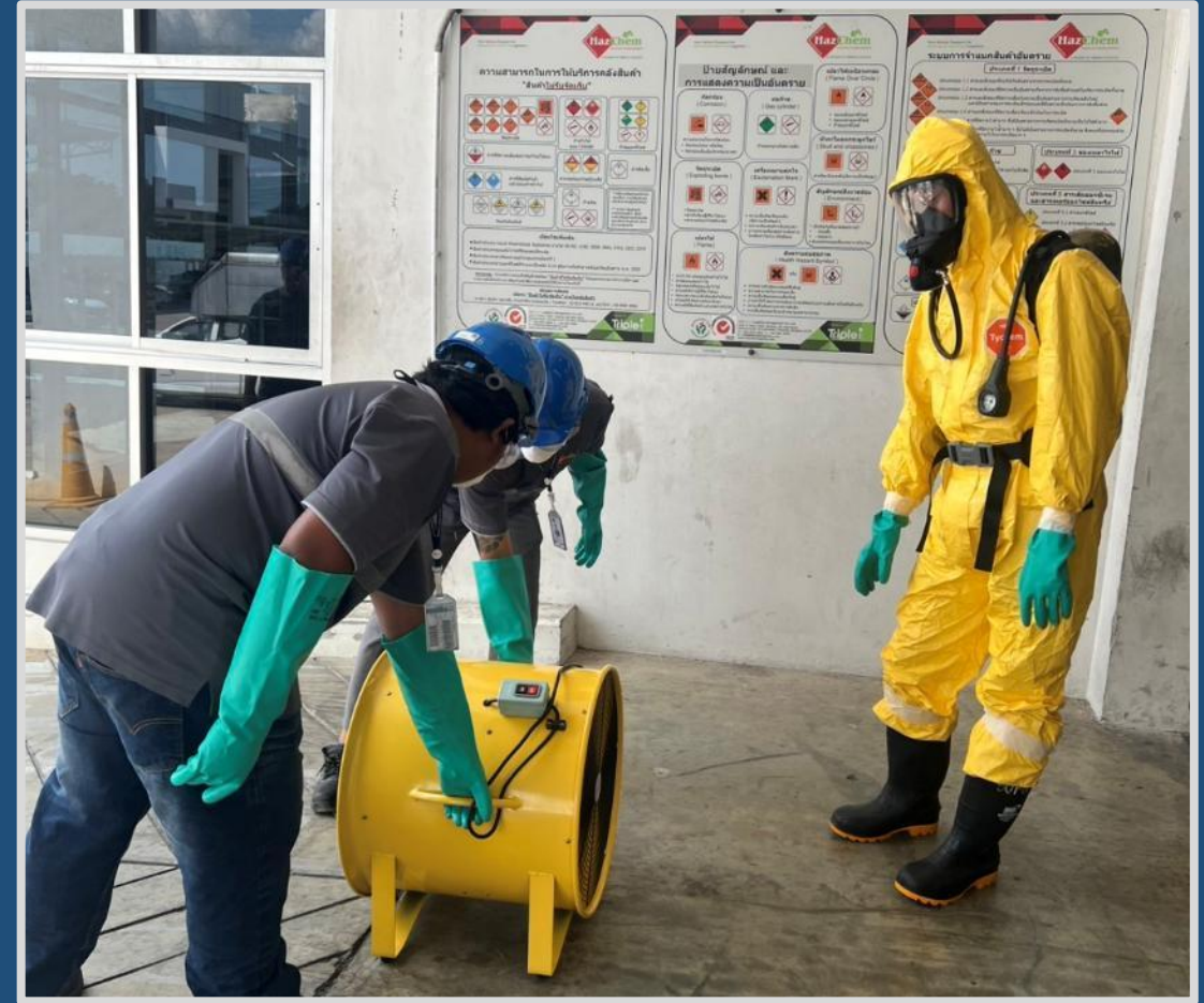
หลักสูตรการฝึกซ้อมแผนการโต้ตอบเหตุการณ์ฉุกเฉินสารเคมีหกรั่วไหลประจำปี