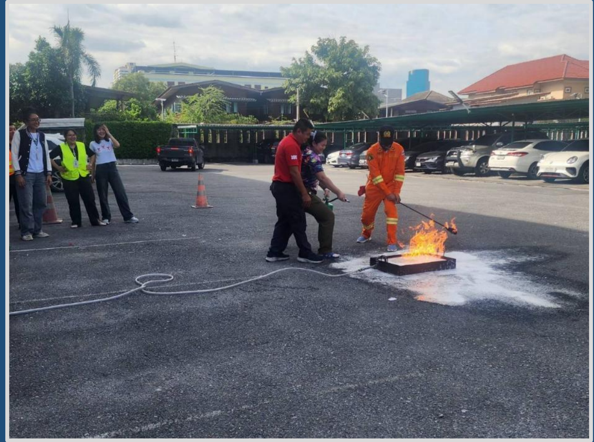
หลักสูตรการดับเพลิงขั้นต้นและซ้อมอพยพหนีไฟ